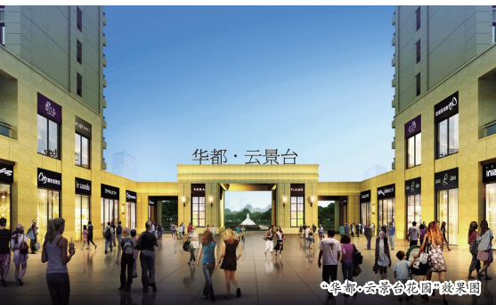
“华都·云景台花园”效果图

日前,华都股份于2015年12月初取得的成都崔家店地块项目正式命名为“华都·云景台花园”。目前项目已正式通过成都发改委立项审查,取得建设用地规划许可证,建筑方案报规划部门审批,已进入施工准备阶段。华都·云景台项目是华都股份继华都·星公馆、华都·美林湾项目成功开发后,在西南房地产市场的又一开拓力作,也是华都进驻成都市场以来,打造的首个