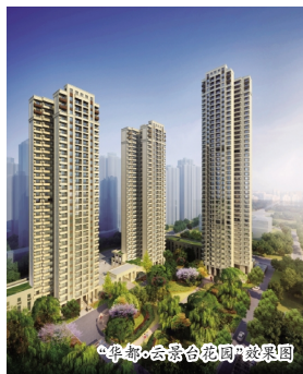
“华都·云景台花园”效果图

超高层住宅产品。华都·云景台项目位于成都市成华区板块,北临成都市华林小学,西临规划道路,南临崔家店路。项目规划总建筑面积约7.3万平方米。项目由两幢31层及1幢42层的超高层住宅沿用地周边布置而成,建筑整体采用Art-Deco风格,立面采用ART-DECO的竖向线条的建筑符号,体现超高层住宅与城市天际线的和谐音符,立面选用精雅有质感的面料,满足成