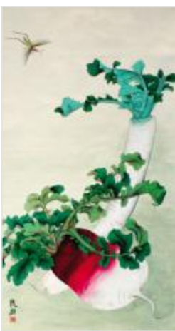
水灵 / 姜良归(新光公司)