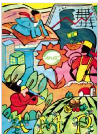
浙农人 / 徐莉莉(明日国贸)